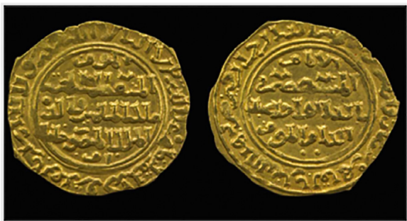
Figure 29, un dinar d'or frappé au nom de Chajar Ador