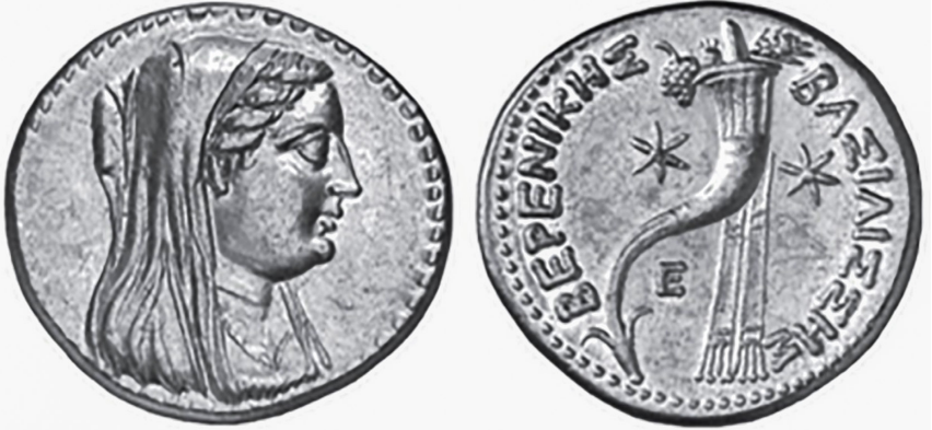
Figure 20, la monnaie de Pernik II en tant que reine gouvernante