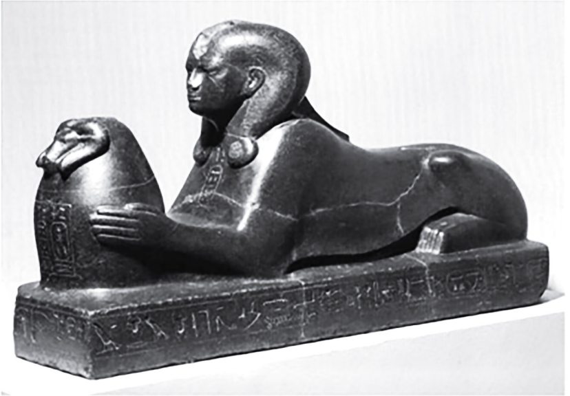
Figure 16 la dévôte divine Chipnopit II sous forme de Sphinx