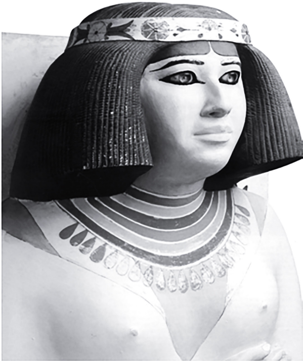
Figure no 2, la Statue de la princesse Nefret