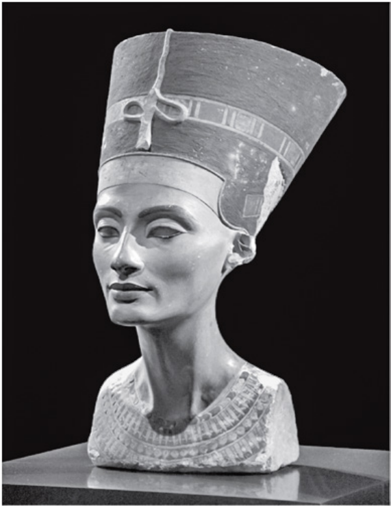
Figure (10) la tête de la reine Néfertiti di calcaire coloré