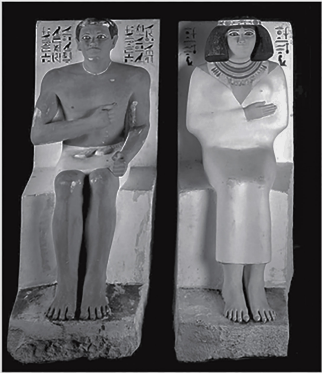
Figure no 1, deux statues individuelles du prince Râ Hotep et son épouse la princesse Nefret de la quatrième dynastie environ 2600 av. J. C.