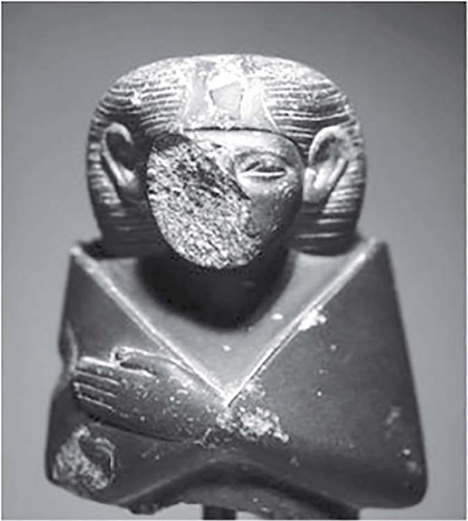
Figure (5) partie supérieure de la statue de la reine Nefro Sopek