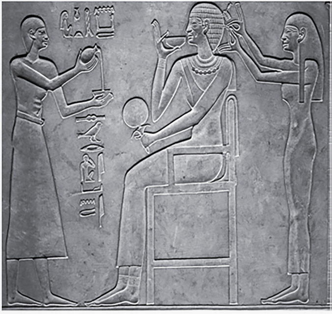
Figure no 4, une vue du sarcophage de la reine Kaw Yet épouse du roi Mentohotep II de la onzième dynastie, vers 2020 av. J. C.