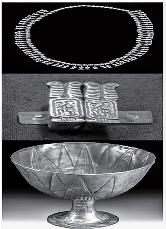
Figure (14), un ensemble de bijoux royaux de la reine Tao Sert