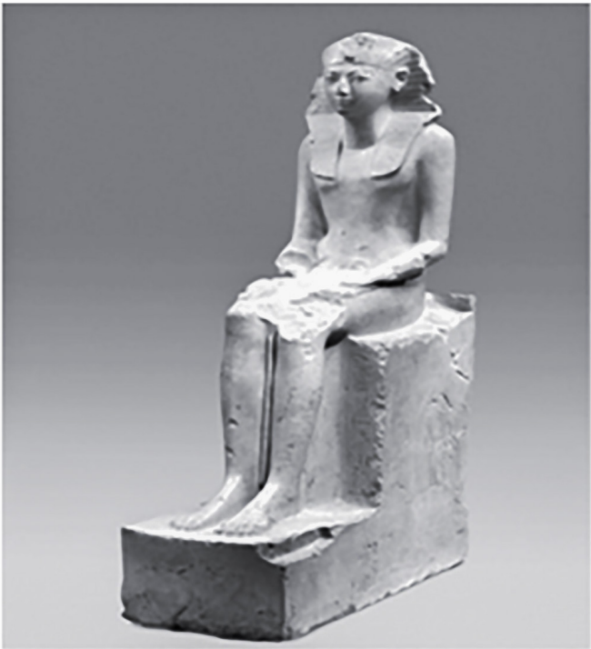
Figure (8) statue de la reine Hatshepsout assise d'une allure royale intégrale