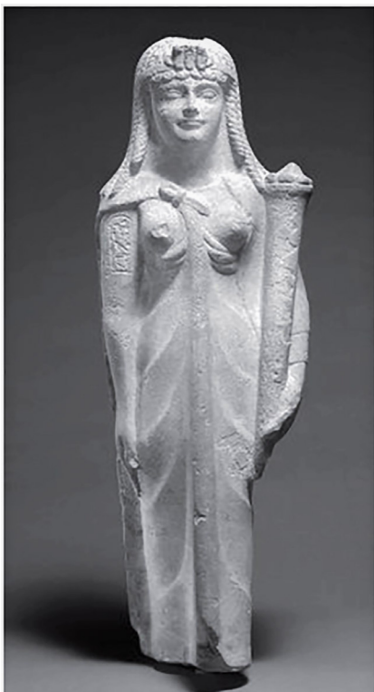
Figure 21, statue de Cléopâtre II tenant par la main gauche la corne du bien.