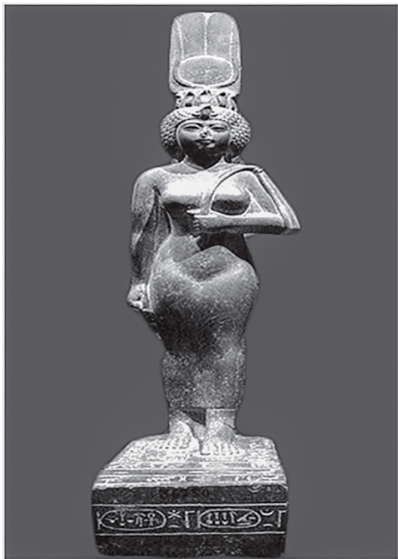
Figure 18, statue en chester de Enkhensinfriberâ