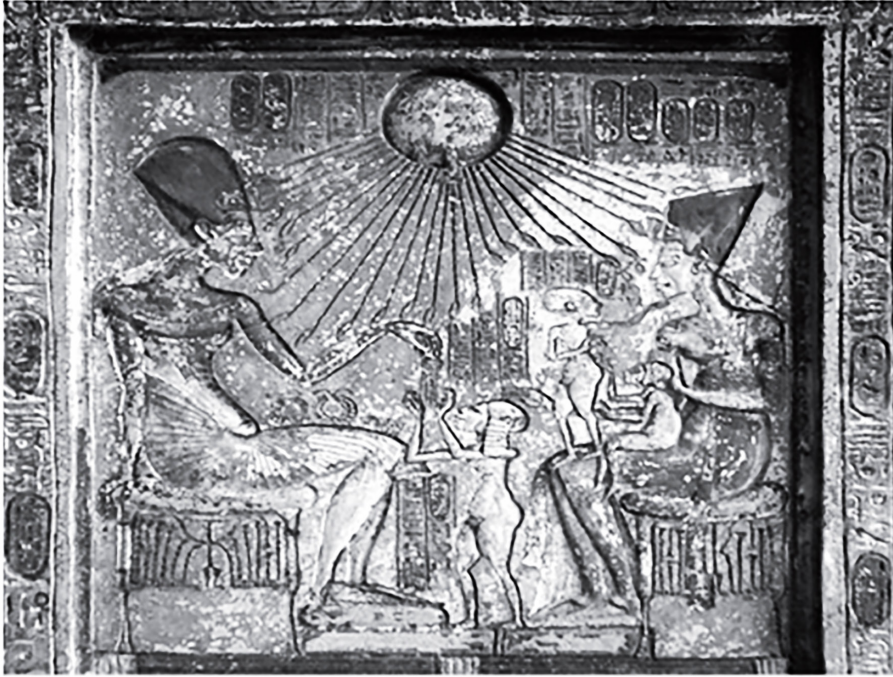
Figure (13) tableau du calcaire, Akhnaton et Néfertiti caressent leurs enfants