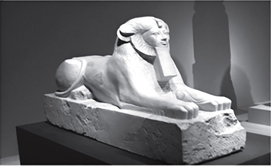
Figure (7) Sphinx de la reine Hatshepsout du calcaire coloré.