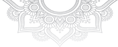
Table des Matières