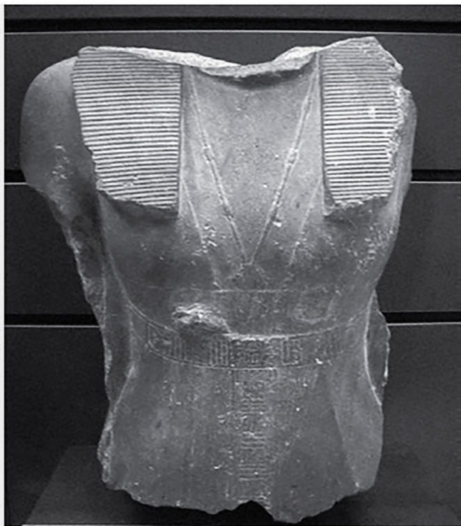
Figure (6) partie médiane de la statue de la reine Nefro Sopek d'une mine royale où masculinité et féminité se mêlent dans une sculpture solitaire.