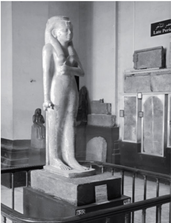
Figure 15 Statue d'alabastre de Amnerdis 1ère