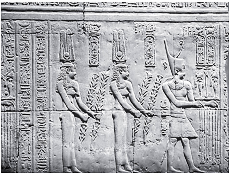
La scène de la présentation des offrandes par les trois souverains : Ptolémaïs VIII, Cléopâtre II et Cléopâtre III pendant leur règne tripartite, le temple de Kom Ombo