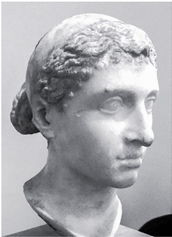
Figure 25, une tête d'alabâtre de la reine Cléopâtre VII