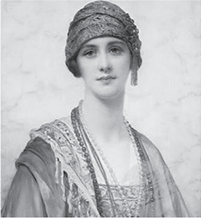
Figure 28, portrait imaginé de la sultane Chajar Ador par le peintre William Klarck Winter, huile sur étoffe, 1920