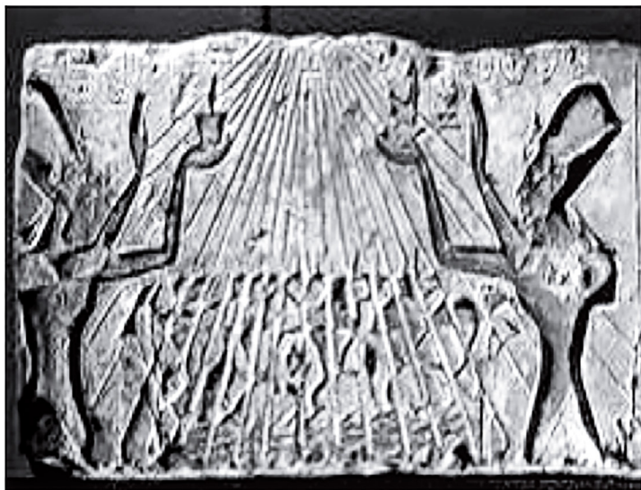
Figure (12) les deux souverains Akhnaton et Néfertari d'une allure égalitaire