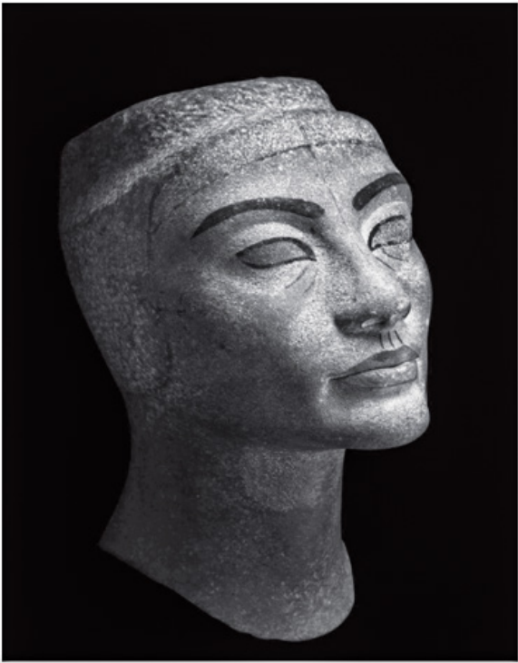
Figure (11), tête incomplète de la reine Néfertiti de la pierre sablonneuse