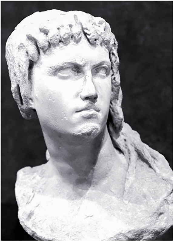
Figure 22, statue en alabastre de Cléopâtre II