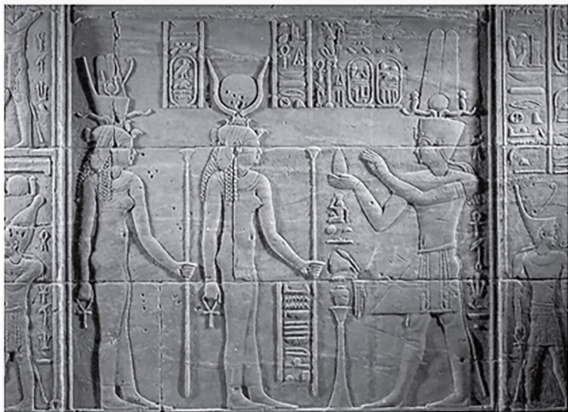
Figure 19, le roi Ptolémaïs II présente l'offrande à Isis et Arsinoë II au temple d'Isis à Philae