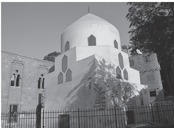
La tome de Chajar Ador