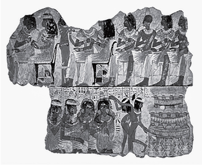
Figure no 3, une scène d'une fête musicale dansante du tombeau Ni Amon de la 18ème dynastie, environ 1350 av. J. C.