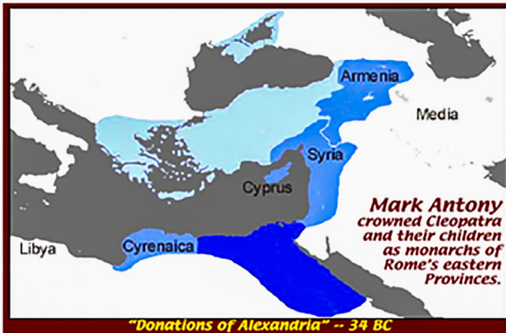
Figure 27, une carte qui montre les royaumes de Cléopâtre et ses enfants, dits les donations alexandrines en 34 av. JC