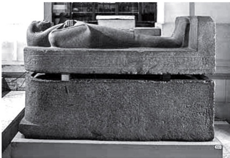
Figure 17 sarcophages en granit de la dévote divine Nit Ekret