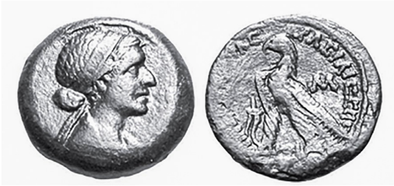
Figure 26, une monnaie bronzite de Cléopâtre VII, son visage sur l'endroit et le faucon, symbole du royaume sur l'envers.