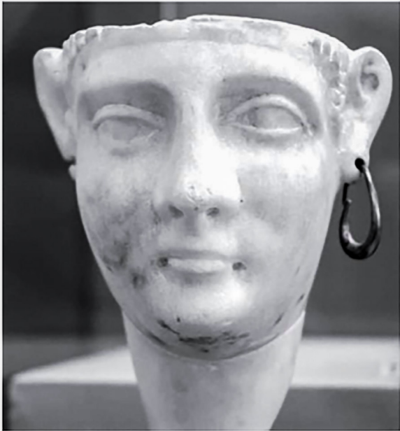
Figure 24, une tête d'alabastre de la reine Cléopâtre III